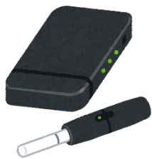
電子・加熱式たばこ