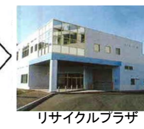
リサイクルプラザ