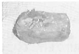
大型ハンマーの頭部分(鉄)