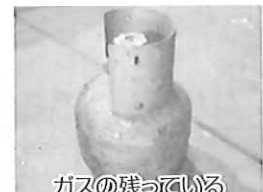
ガスの残っている プロパンボンベ