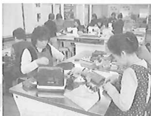
リフォーム講座(上)とその作品(左)