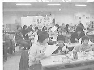
子ども向け工作(下)とその作品(右)

リサイクルプラザでは、身近にある不要になったものを利用した作品作りを行っています。夏休み・冬休みの工作やリフォーム講座など、気軽に参加できる内容です。ぜひご参加ください。