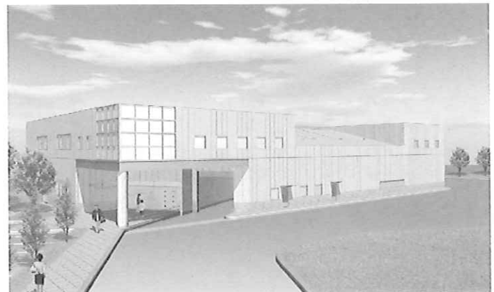
リサイクルプラザ (完成予想図)