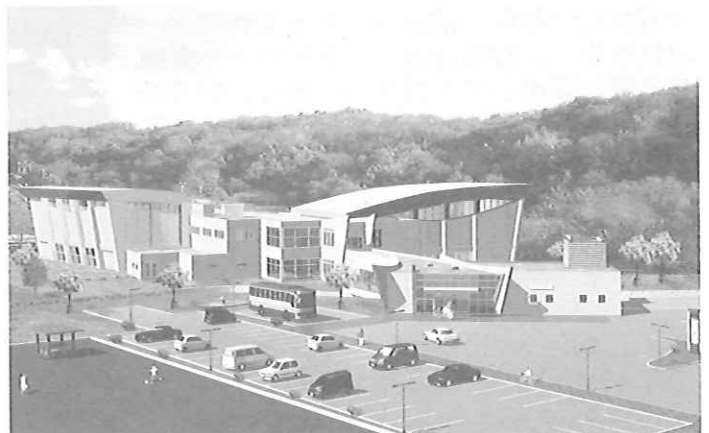
げんき館ペトトル (完成予想図)