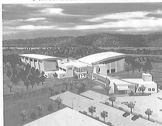
余熱利用施設のイメージ図