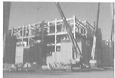
広域ごみ処理施設の工事現場の様子