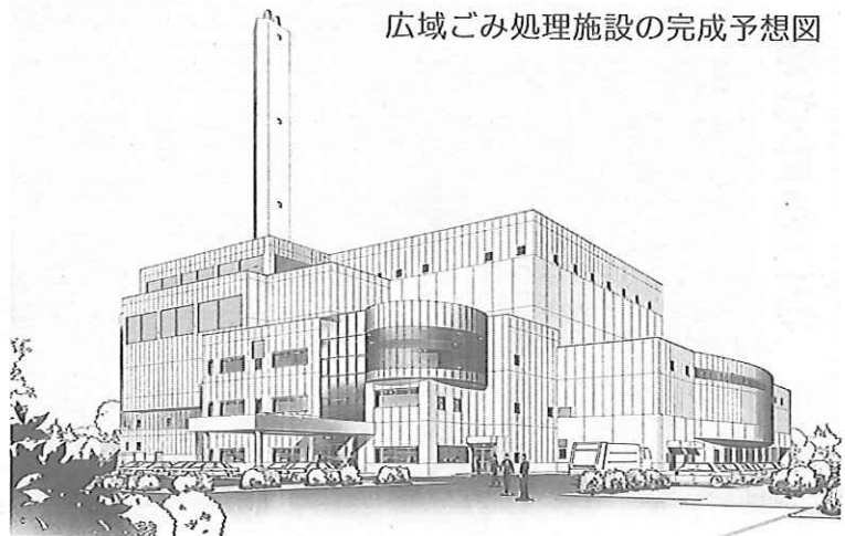
広域ごみ処理施設の完成予想図