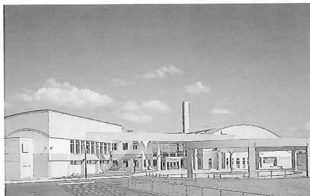
旭川市の余熱利用施設「近文市民ふれあいセンター」

施設の内容は、だれでも自由に利用できる健康増進施設として、ミニ体育館、温水プールなどの建設を予定しています。